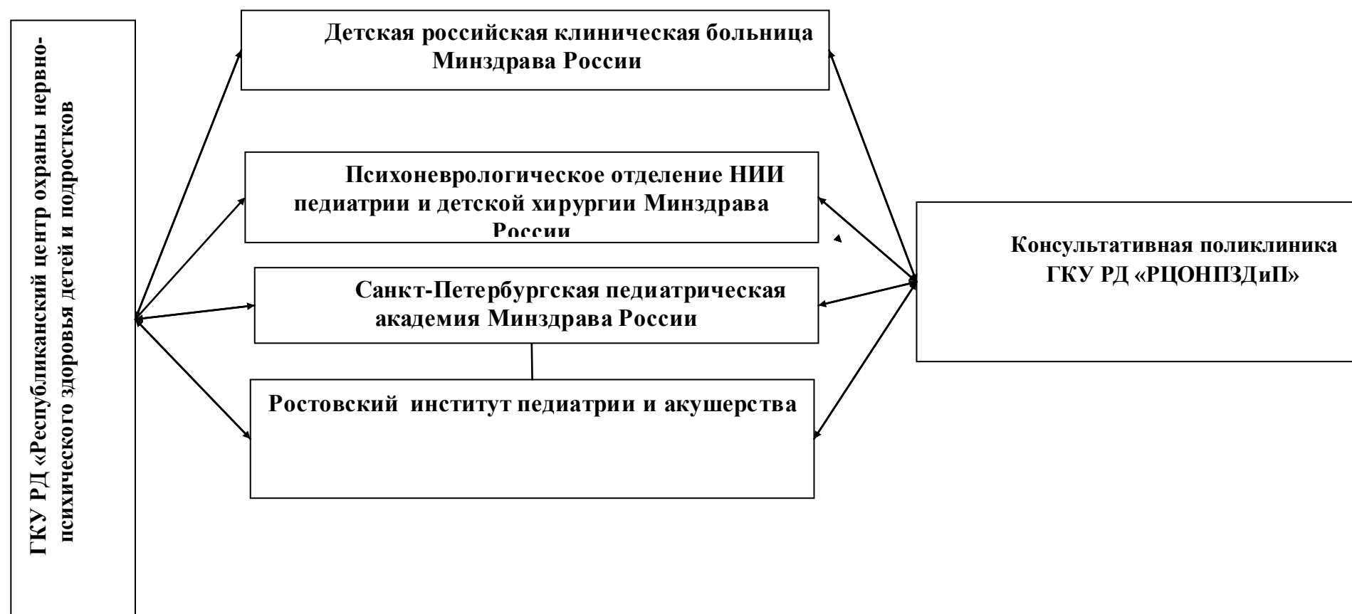
Схема организации и взаимодействия при оказании медицинской помощи детям, страдающим неврологическими расстройствами на IV уровне для оказания специализированной медицинской помощи за пределами Республики Дагестан