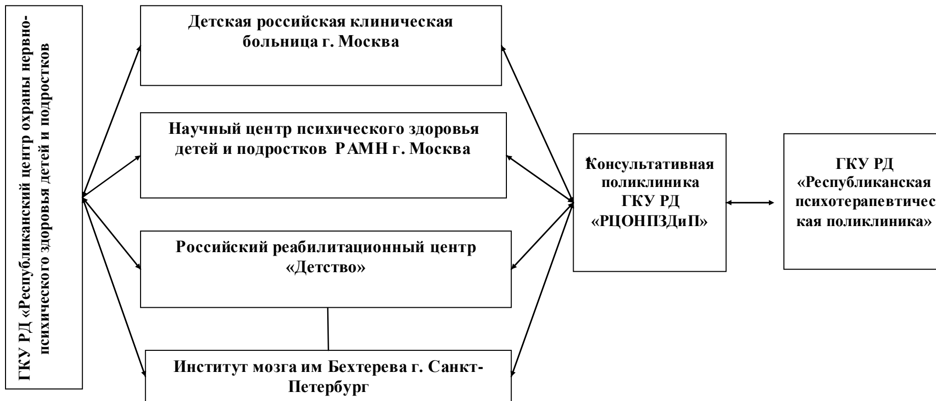
Схема организации и взаимодействие при оказании медицинской помощи детям, страдающим психическими расстройствами на IV уровне для оказания специализированной медицинской помощи за пределами Республики Дагестан